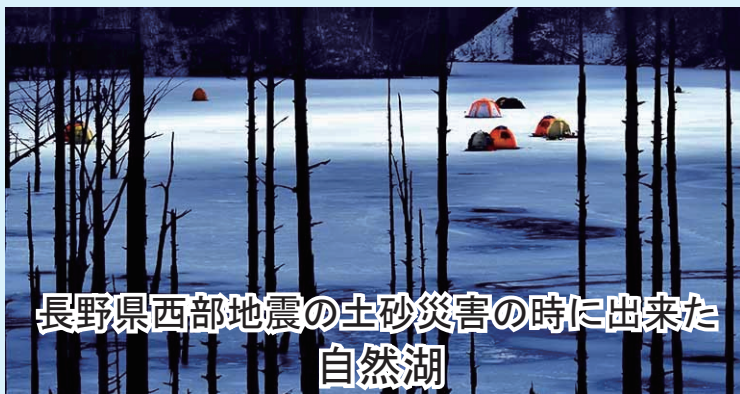
長野県西部地震の土砂災害の時に出来た 自然湖